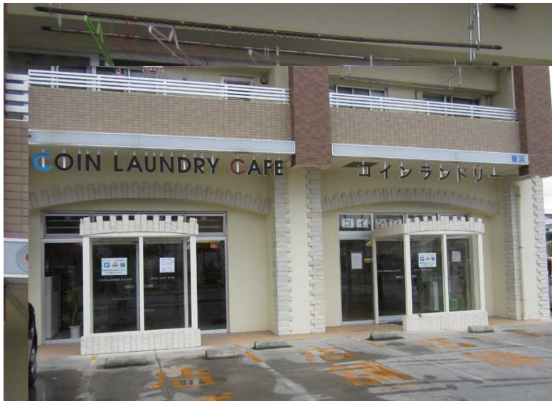
写真沖 1－ 11 コインランドリーカフェ本店