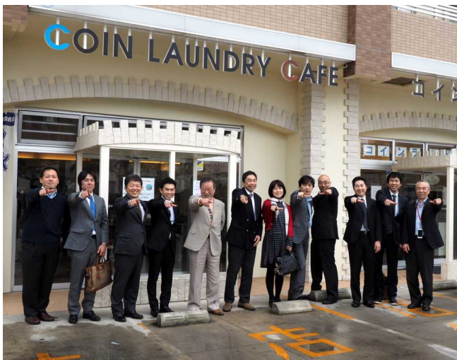
写真沖－3 チョット遊んで集合写真