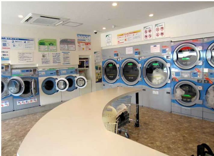
写真沖－５ 店内・洗濯機と乾燥機