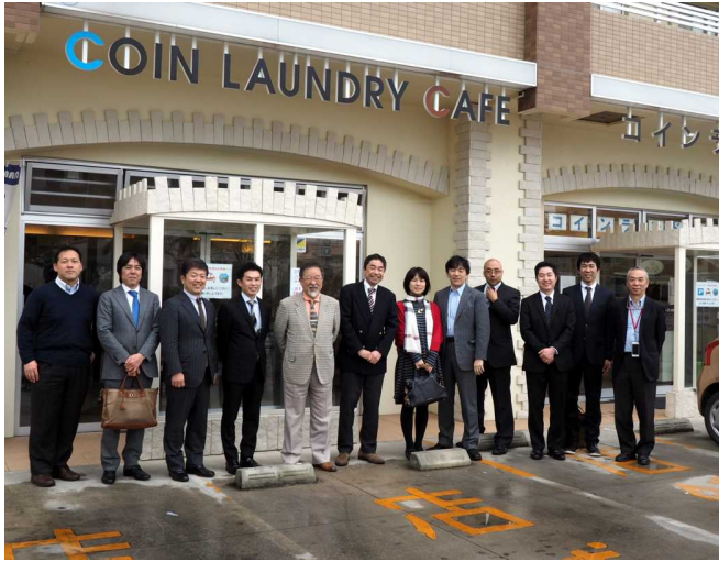
写真沖－2 集合写真（まじめ版）