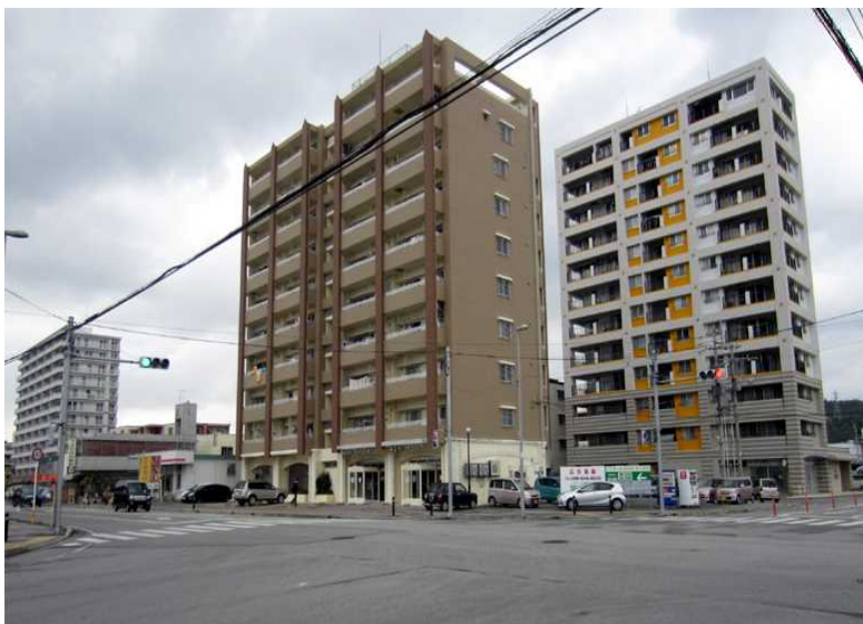
写真沖 - 18 店舗後側