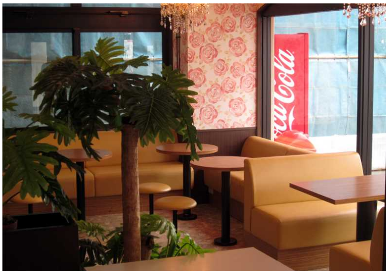
写真沖－ 7 カフェ（休息）スペース