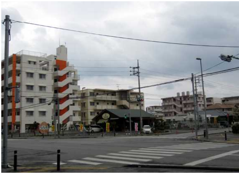
写真沖 1 - 17 店舗向かい側