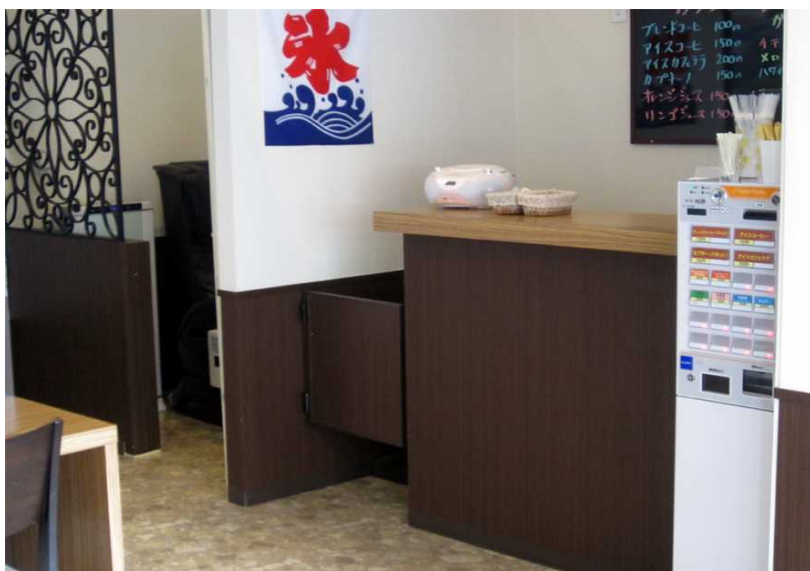
写真沖－ 8 ドリンクコーナー