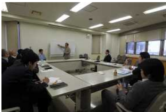
写真沖-1 総会で話をする私