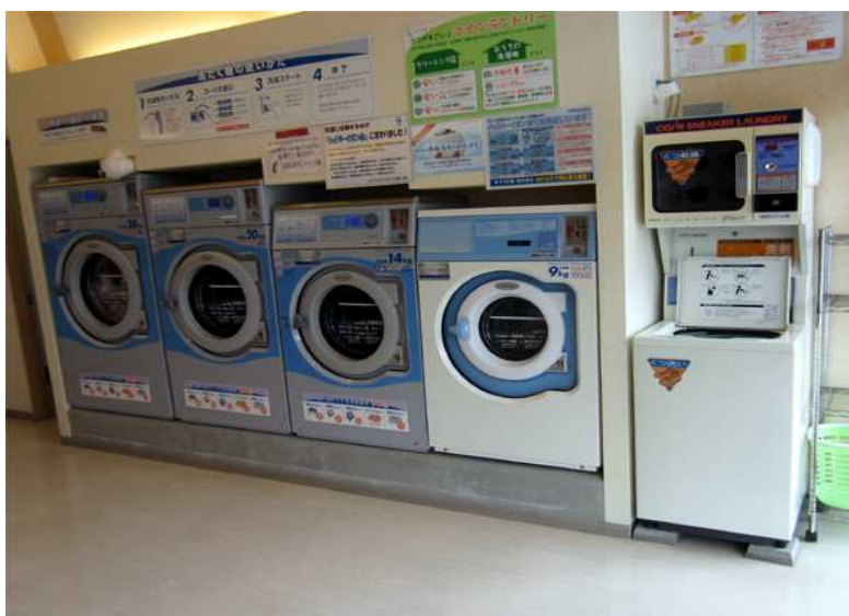
写真沖－ 12 本店・洗濯機