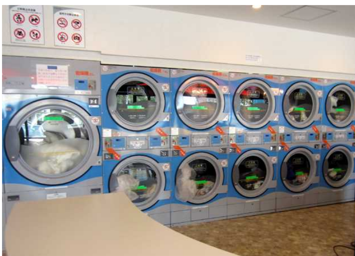
写真沖－６ 店内・乾燥機