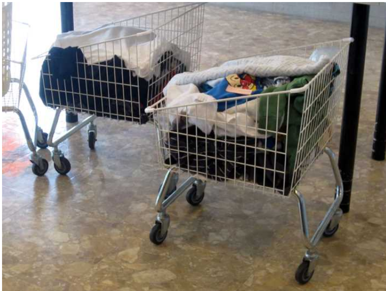
写真沖－ 10 取り出された商品、後で畳まれます