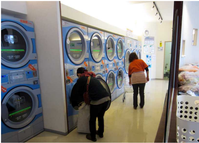
写真沖－ 13 本店・乾燥機、お客さまと従業員