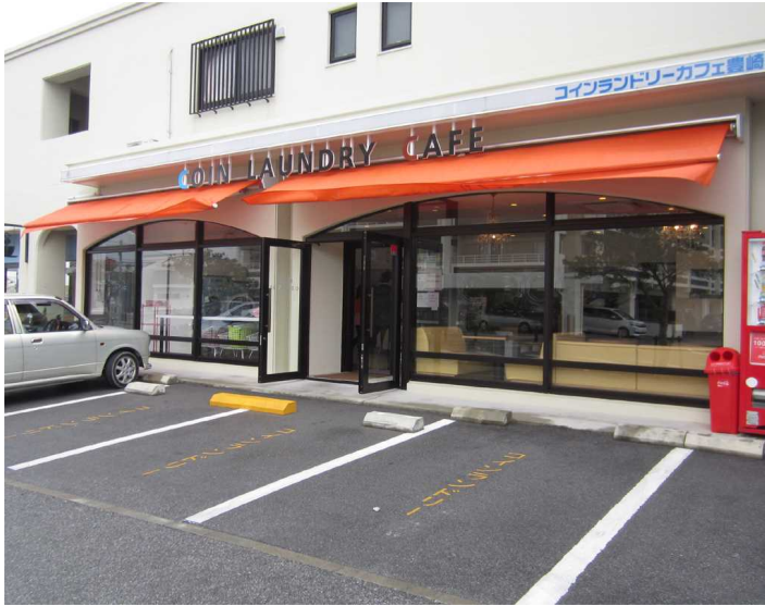
写真沖－４ コインランドリーカフェ豊崎店