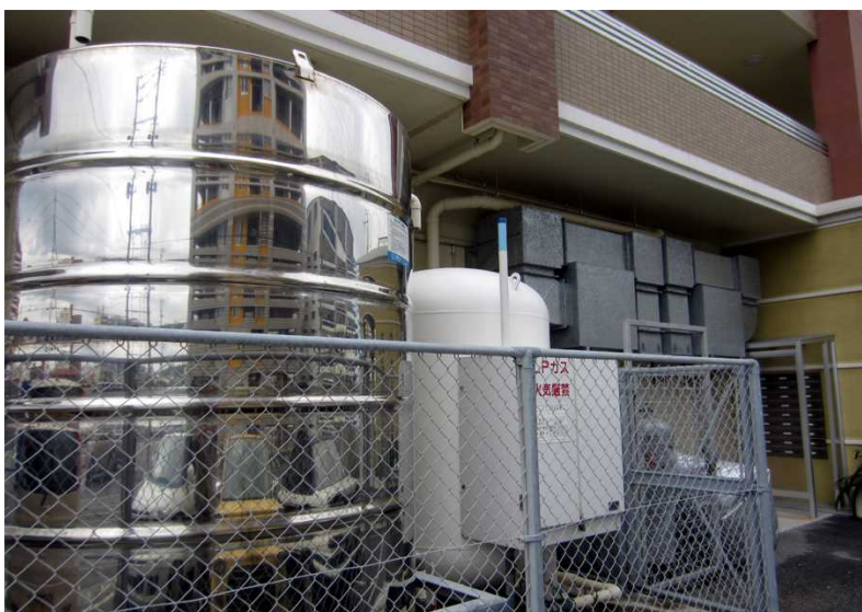
写真沖－ 15 LPガスタンク