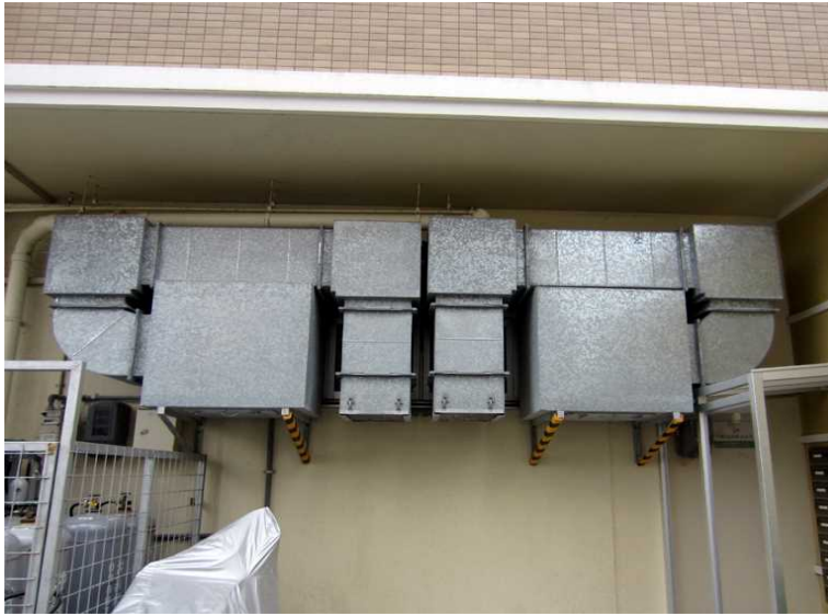
写真沖 - 16 排気設備