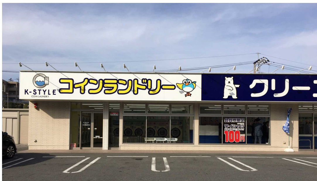
写真4 桜台店全景（ワイシャツ100円？）

※この点は、研修会の中でも大いに議論されましたが、社長が割り切って（納得して）この価格にしたのであれば良しと思いますが、どうも社長が納得しきっていないことが問題のようでした。