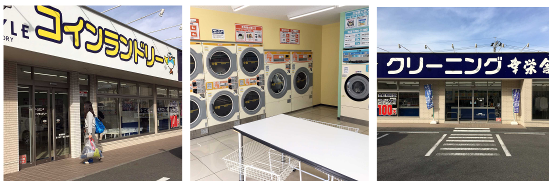
写真5 コイン外観 写真6 コイン店内 写真7 クリーニング ※翌日行った、幸栄舎への問題点の確認、検討、対処については別途レポートにして提出します。