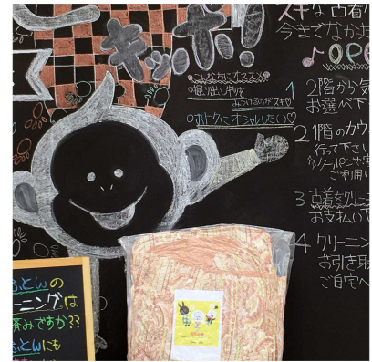
写真17 2階より 写真18 告知ポスター 写真19 告知ボード

機会を作っても見られると、従来に無いクリーニングショップを感じる事が出来ると思います。是非、一度お出かけください。