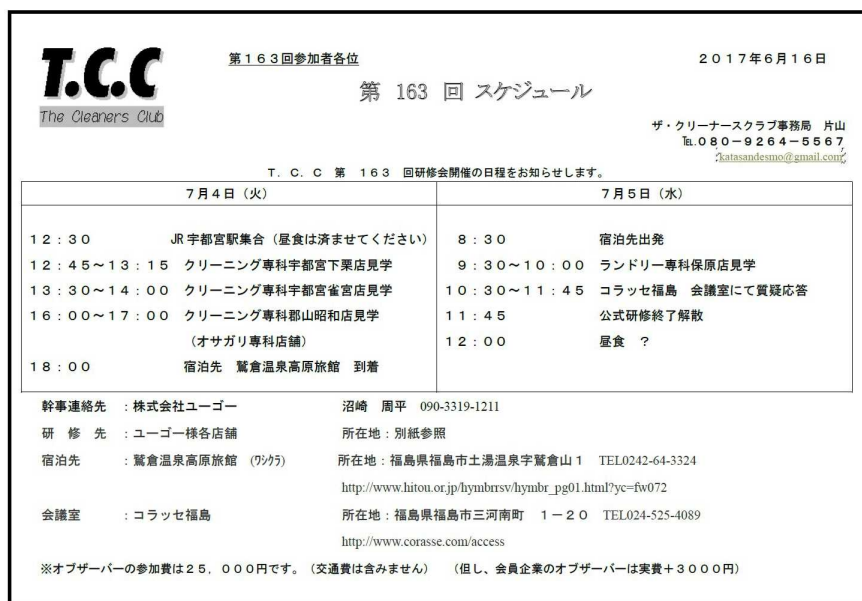
写真1 163回 研修スケジュール

見学日程（写真01）は下記のようなものでした。また、前もって、見学先の資料（写真02）が配付されました。