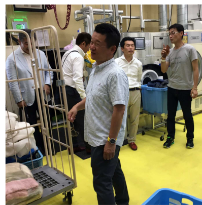
写真10 湿気が少ない？