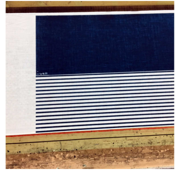
写真 5 - 6