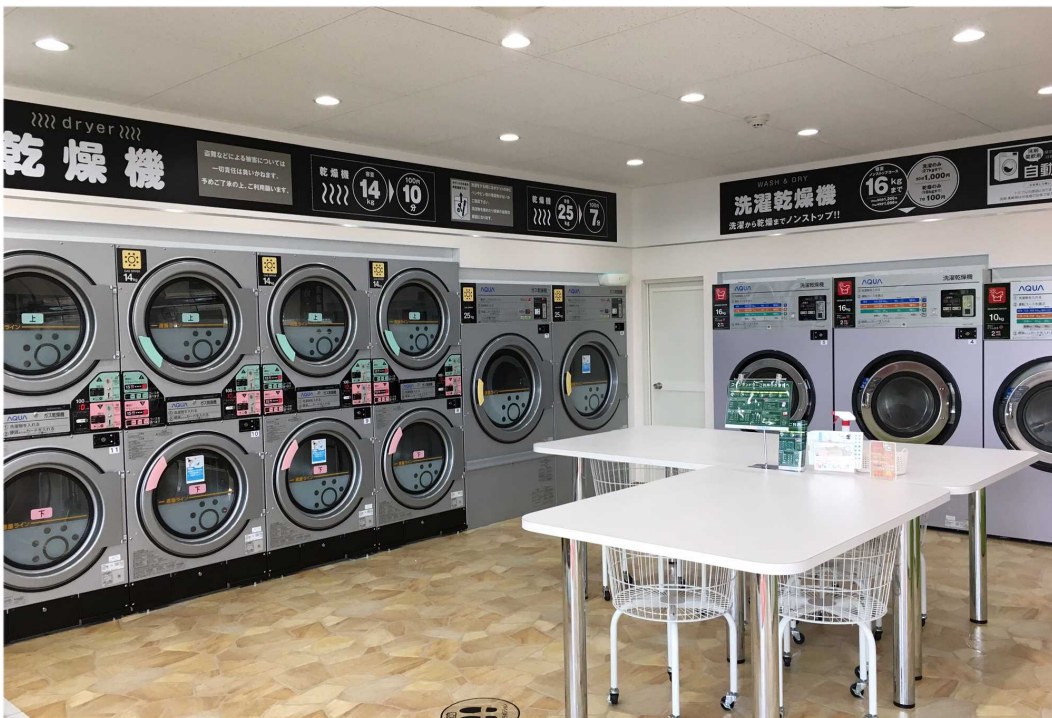
写真 3-8 コインランドリーの設備 (とてもスッキリしていました)

写真 3-6 は、トリックアート (帆かけとアライグマ) とボルダリングのセットです。