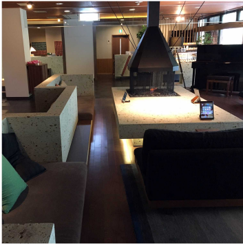
写真 2 - 5