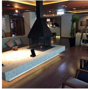
写真 2 - 6