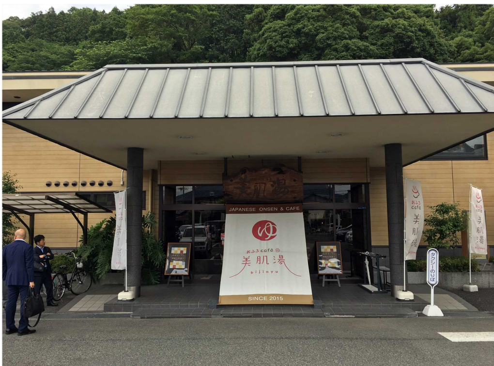
写真2-1 おふろc a f e' 美肌湯

もとは美肌の湯としてあったものですが、これが茨城を本拠とする「おふろカフェ」のフランチャイジーとして、リニューアルオープンしました。