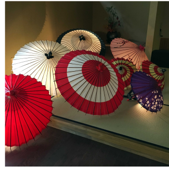
写真 2 - 7