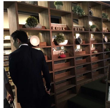
写真 2 - 10

写真 2 - 5 ~ 7 は、1 階ロビーフロアと奥に見えたディスプレイ。写真 2 - 8 ~ 10 は、2 階リラックスフロアとライブラリーの様子です。