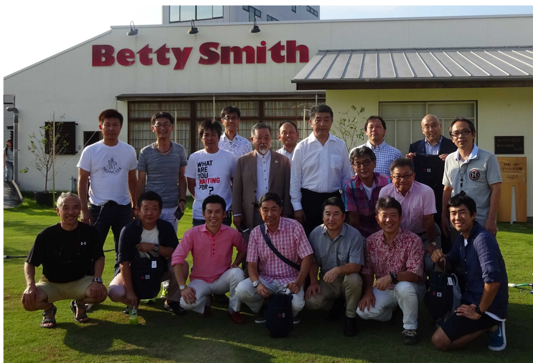
ベティスミスでの集合写真

従って、今回もあまり乗り気では無かったのですが、作ったジーンズの着用したところ「結構似合っている」たか「もう一枚作れば」などと言われ、少し浮かれています。