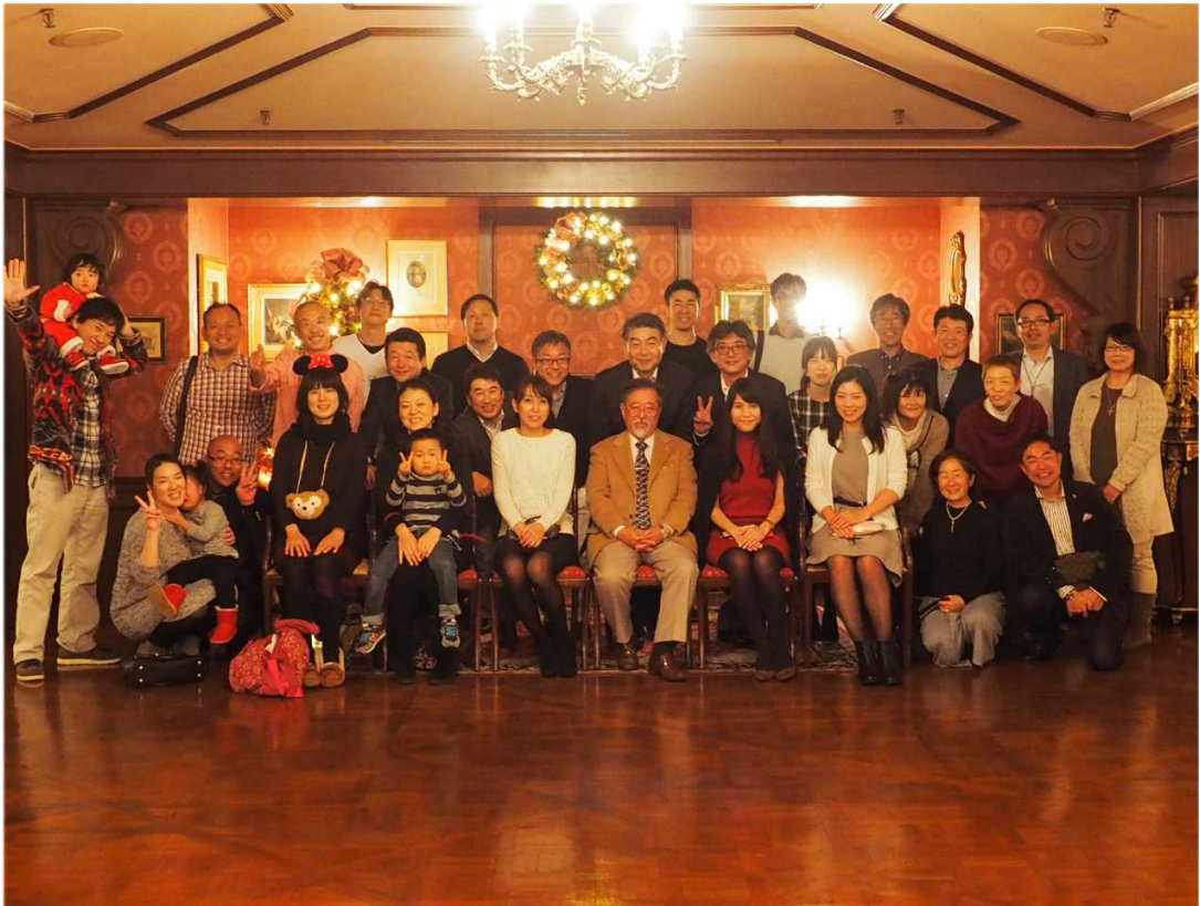
忘年会を終わって・集合写真

残念ながら、数名の欠席を見ましたが、これから先にもこのような集まりが持てるようにありたいと強く思いました。